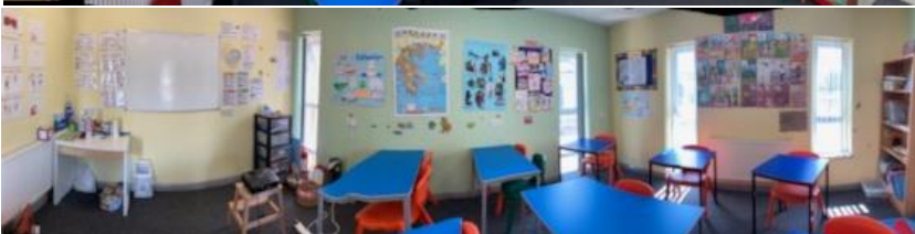
Αίθουσα για τις τάξεις Δημοτικού- Primary Years classroom