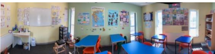
Αίθουσα για τις τάξεις Δημοτικού- Primary Years classroom