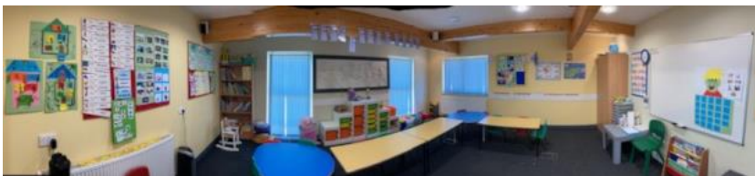
Η αίθουσα του Νηπιαγωγείου/ Προδημοτικής -The Early Years class